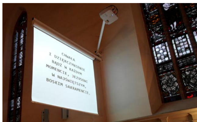
Wyświetlanie tekstu i obrazów z projektora multimedialnego NEC

szej generacji odbywa się to bez konieczności przełączania wejścia na projektorze czy ekranie plazmowym, co w znaczący sposób upraszcza obsługę podczas mszy świętej, a samo przełączanie zdjęć odbywa się za pomocą pilota drogą radiową, a nie przez podczerwień, co znacząco podniosło komfort obsługi. Zmiany te były możliwe dzięki temu, że zdjęcia wgrywane są bezpośrednio do Multimedialnego Śpiewnika, a nie są odtwarzane z urządzeń dodatkowych typu DVD czy pulpity USB/SD, często montowanych przy ekranach.