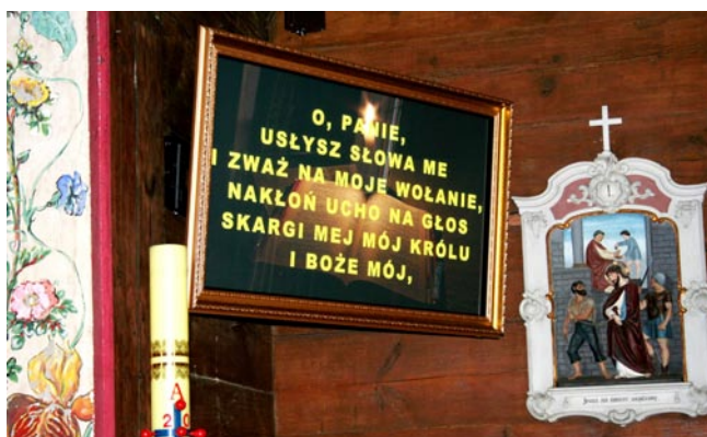
Ekran plazmowy 50 cali